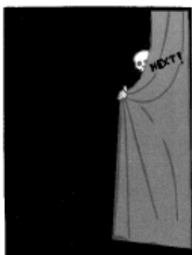
Y a-t-il une vie du spectacle après la mort des intermittents ?